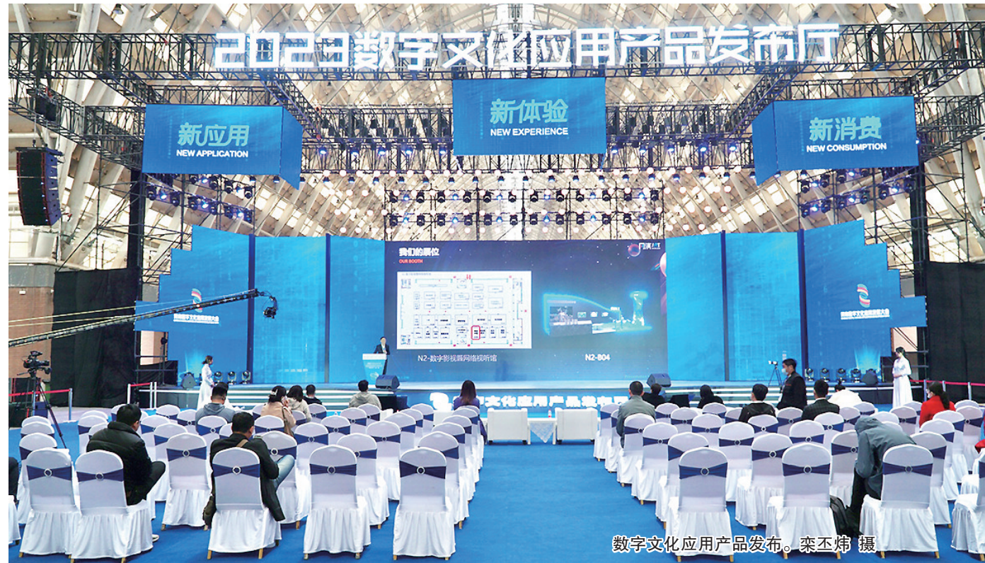
数字文化应用产品发布。