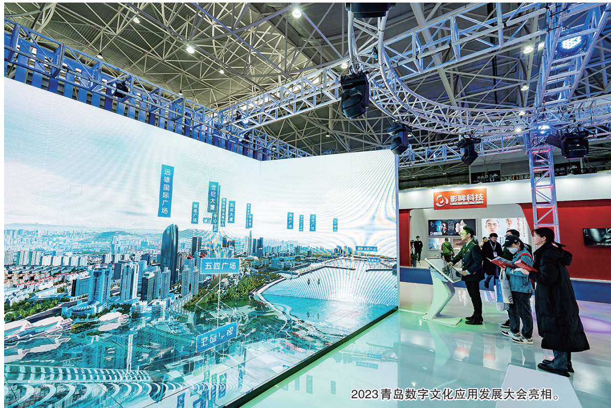
2023青岛数字文化应用发展大会亮相。