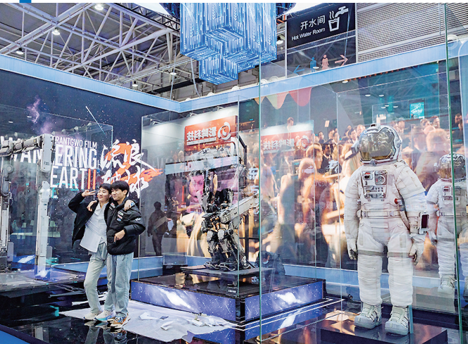
游客在展会合影留念。

在元宇宙空间阅读,在手机里在线“爬长城”,与数字人“易小安”“泉小荷”们说说话……4月6日,2023青岛数字文化应用发展大会在青岛西海岸新区正式开启,大会为期4天。当天上午,记者来到青岛西海岸新区青岛世界博览城6大展馆实地探访,“抢鲜”感受在数字赋能下,文旅产业迸发出什么样的新活力。