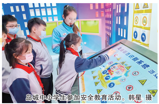
岛城中小学生在参加安全教育活动。

本报3月28日讯 28日,市教育局发布了2023年青岛市教育局直属学校体育艺术特长生和足球后备人才招生计划,27所公办、民办高中和初中学校共计划招生863人,其中公办局属普高计划招生662人,中职学校计划招59人,民办学校计划招86人,青岛实验初中、青岛三十七中两所局属公办初中计划招56人。