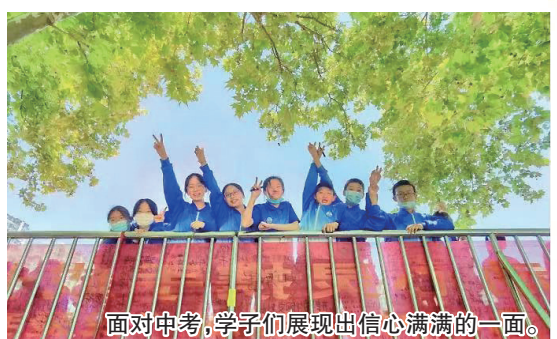
面对中考,学子们展现出信心满满的一面。