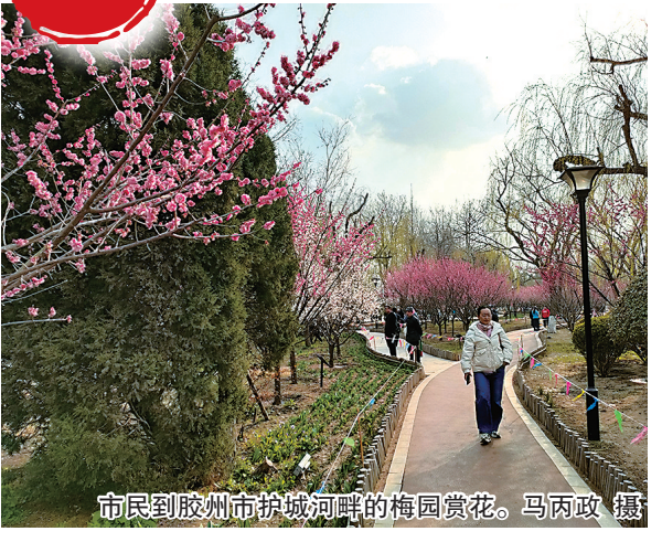
市民到胶州市护城河畔的梅园赏花。

春水初生，春意正浓。一园梅、一缕香、一季花开，惊艳了一段时光，吸引着人们前来。近日，位于胶州市护城河畔的梅园内，一树树梅花开得正灿烂，空气中弥漫着沁人心脾的花香，传递着春天的气息，给春日的胶州增添了一片生机，也开启了梅园新一年的赏花期。 记者来到梅园里看到，有白色、粉色和紫色等梅花竞相绽放，一朵朵，一团团，一簇簇梅花俏立枝头，绽放笑颜。梅园的梅花已进入主花期，不同品种梅花陆续绽放，通过树上挂着的科普小卡片，扫码就能知道梅花的品类和特性。远远望去，成百上千朵梅花竞相开放，似一个个红色的小精灵，绕着树枝飞舞，让人大开眼界。亭亭玉立，白里透红，粉色的花蕊点缀其间，被风一吹，纷纷飘落，像下了一场梅花雨，不少市民拿着手机拍照，记录美丽的瞬间。 与此同时，梅园内的郁金香已悄悄拔高，东侧、北侧沿河区域的洋水仙也露出了花苞，开出黄色的小花，花与花的蜜语，仿佛在说悄悄话。洋水仙和郁金香一共3000平方米，是分区域混种的，它们花期不同，预计三月底四月初便会迎来花期。 观海新闻/青岛晚报 记者 马丙政 马妮娜