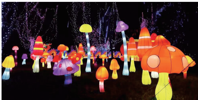
老里院里有蘑菇灯等待游人探寻。

继年初爆款节庆逛街里之后，市南又开始酝酿一场新惊喜——上街里·逛春天旅游艺术季倒计时中，大量人流已经再次奔涌而至——作为此次旅游艺术季的“首发阵容”，一场老城灯光秀在不断预演、调试中日臻完善，市民、游客提前争睹青岛地标栈桥、小青岛、海上皇宫、中山路、大鲍岛流光溢彩。这场灯光秀，以老城肌理作为灯光艺术的展现媒介，将为市民、游客带来一场可以预见的视觉盛宴、全民狂欢。在繁花如云、灯火璀璨、人潮人海中，市南历史城区正以一种全新的表达方式重申：老城已醒，涅槃归来。