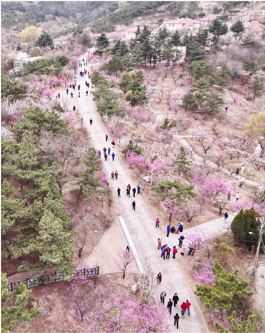
十梅庵青岛梅园梅花盛开。