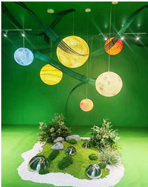
位于高密路上的色彩实验室。

记者在高密路、海泊路等区域探访发现，这里正在进行街区氛围的提升和重要节点亮化工程的调试工作。海泊路、博山路、高密路、潍县路等重要节点正在进行景观亮化，如高密路与中山路路口将打造一处梦幻走廊，由此路口进入大鲍岛街区，将犹如进