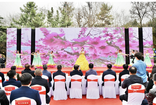
梅花节开幕式文艺演出。