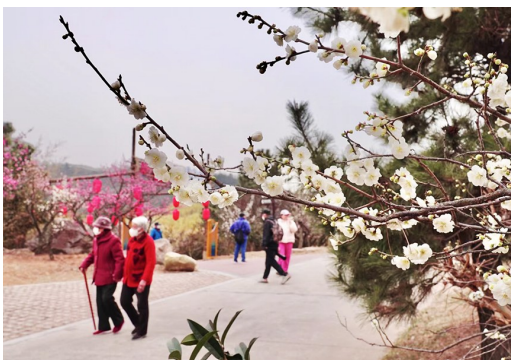
不少市民到十梅庵青岛梅园赏花。