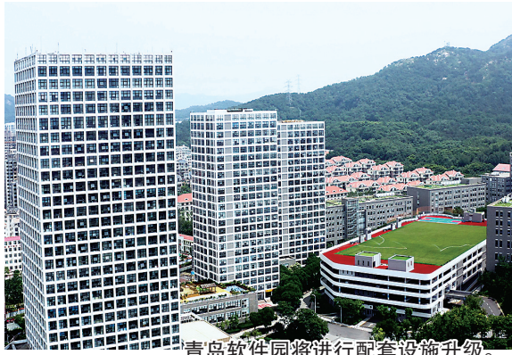
青岛软件园将进行配套设施升级。

“今年,市南区将力争全年完成15座以上楼宇更新升级;探索国有平台介入,联合社会资本收购东航大厦等独栋或联层楼宇,引入知名运营商,盘活闲置载体资源。”市南区招商投资发展中心相关负责人介