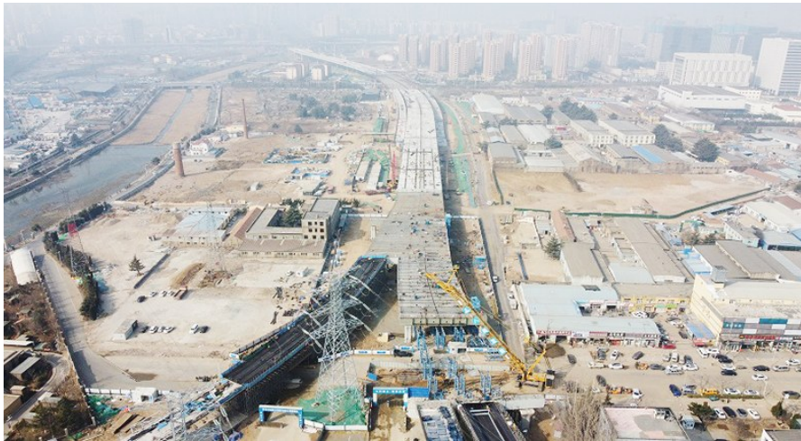
跨海大桥高架路二期施工现场。

记者来到中建八局发展建设公司参与建设的跨海大桥高架路二期项目施工现场,180余名建筑者正在推进连续梁钢筋绑扎、模板安装、钢箱梁焊接等各项施工