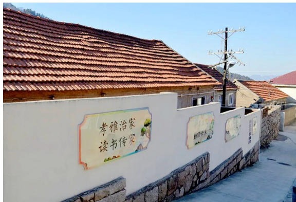
崂山北宅村容村貌“微整治·精提升”。

“过去的环境跟现在没法比，现在越来越好啦。”家住慕武石村的居民表示，“村里乱堆乱放的情况基本没有，田间地头也都清理得干干净净，让人很舒服。村里还用奖励煤气票的方式，鼓励大家做好房前屋后的卫生，既干净又能得到实惠，真是‘双赢’。”