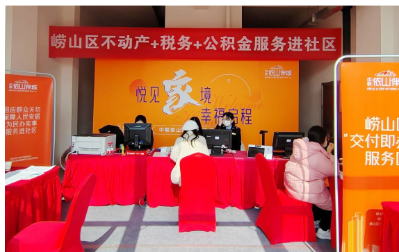
依山伴城四期交房，居民家门口拿证。

本报3月1日讯 近日，崂山区自然资源局不动产登记中心协同崂山区税务局、青岛市住房公积金管理中心崂山管理处等部门，进驻依山伴城四期交房现场，为业主们提供交房即办证和政策宣讲进社区服务。这是崂山区不动产登记和公积金办理首次联动进社区，为业主提供贴心服务，方便业主可就地一并办理多