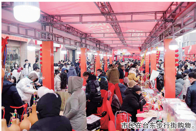
市民在台东步行街购物。

正月十五,许多青岛人在台东找到了过年的正确打开方式!2月4日,全国迎春消费季——2023“老字号嘉年华”暨“惠享山东消费年”启动仪式在青岛台东国家级步行街举行。本次活动由商务部、山东省政府主办,山东省商务厅、青岛市政府承办,旨在深入贯彻落实党的二十大精神,把恢复和扩大消费摆在优先位置,促进老字号守正创新,激活全国迎春消费活力,全面启动系列主题促消费活动。