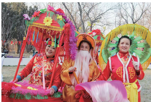
文艺汇演在热闹秧歌表演中拉开帷幕。

本报2月5日讯 又至元宵节,由市南区八大峡街道办事处主办的学习贯彻党的二十大精神文化惠民系列活动之“情系元宵节 乐在团岛山”文艺汇演在团岛山公园举行。秧歌社火、京剧戏曲、精彩歌舞等好戏连台,现场气氛火热。