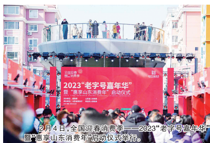
2月4日,全国迎春消费季——2023“老字号嘉年华”暨“惠享山东消费年”启动仪式举行。