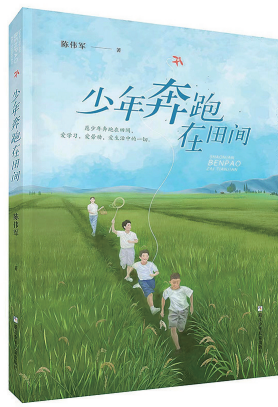
陈伟军 著 浙江少儿出版社 2022年11月出版

《你好，优诗美地》被成君忆称为“小说体散文”，里面加入了引人入胜的小说元素，同时又充满了扣人心弦的哲学之问。“人们生活在一个世俗的经济学社会，却又在内心深处盼望着一个纯美的桃花源。”这本书是新时代“知青”成君忆描摹的“未来乡村”梦。