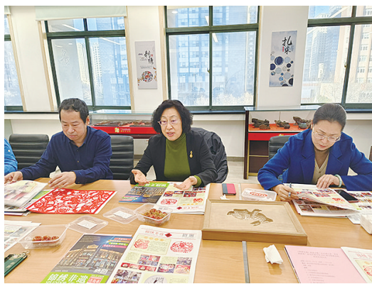
《锦绣非遗》座谈会在市图书馆举办。

《锦绣非遗》座谈会暨“品非遗之美 享多彩新春”青岛市图书馆2023年春节传统文化活动启动仪式昨日在图书馆西四楼非遗阅读馆举行。2023年是农历癸卯兔年,由青岛市图书馆、青岛大学图书馆、市南区文化馆主办,青岛锦绣非物质文化遗产研究中心编辑的《锦绣非遗》兔年贺春专刊也在此时隆重发行。