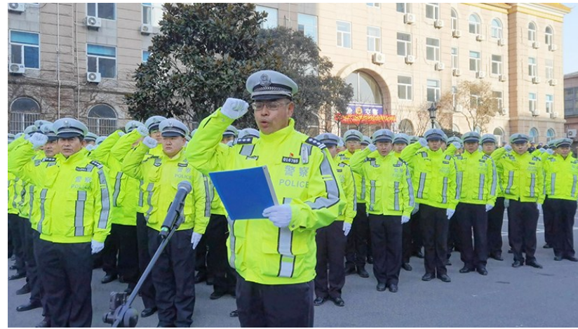
青岛市公安局交通警察支队李沧大队民警面向警旗宣誓。