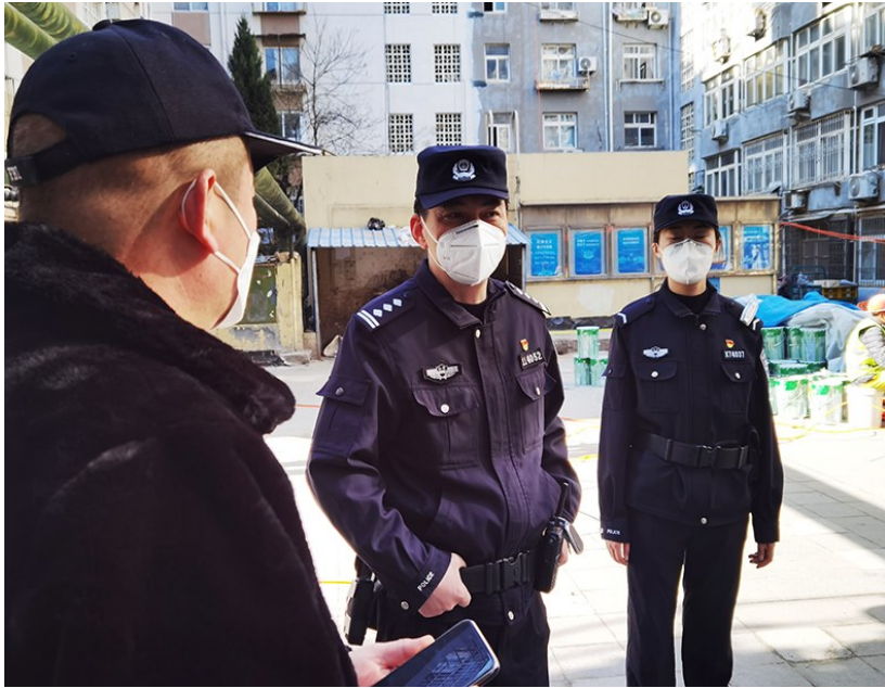
民警在走访社区群众。

前几年,随着经济社会发展的人口结构变化,青岛西部老城区逐渐沉寂。随着城市更新与城市建设的不断推进,老城区的面貌正在不断改观。1月9日,第三个中国人民警察节到来之际,记者跟随即墨路派出所民警,见证了他们这份别样的守护。