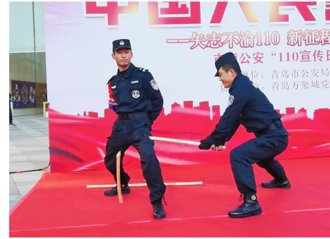
市南公安分局特巡警在展示硬气功。

1月10日是警察节,也是全国第37个“110宣传日”。当天,青岛市公安局各分市局和相关警种都举办了内容丰富的活动,宣读入警誓词,重温入警初心,向市民普及110相关知识。