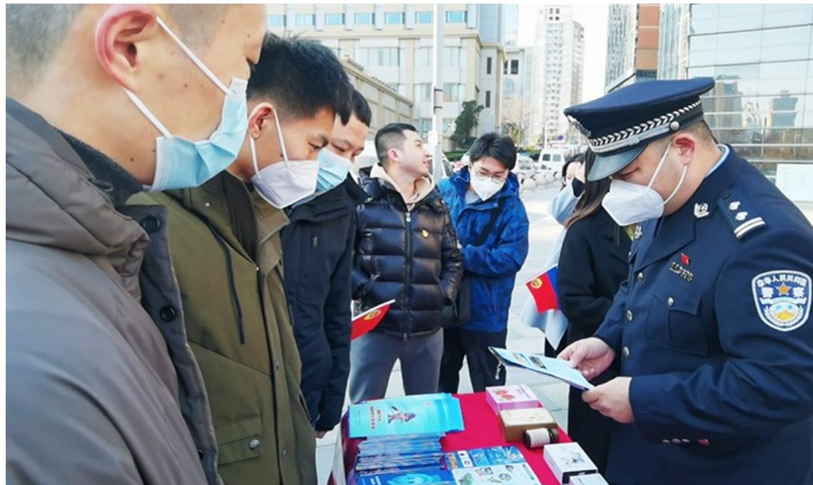
市南公安分局民警在向群众宣传安全知识。