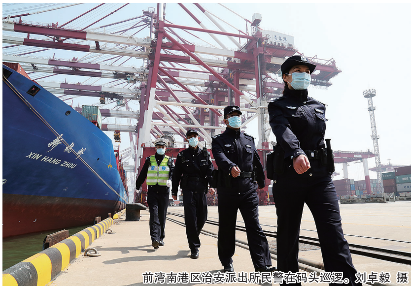
前湾南港区治安派出所民警在码头巡逻。

海洋是青岛靓丽的天然名片，港口更是青岛的资源优势和优势。随着青岛经济社会的发展，2022年山东港口青岛港货物、集装箱吞吐量分别增长4.3%、7.9%，交出了一份亮眼答卷。 青岛港前湾港集装箱码头，每天都有满载集装箱的货轮进出港。在这个东北亚吞吐量第一的码头及其周边，青岛市公安局港航分局前湾南港区治安派出所打造了上下联动、条块结合、整体作战的警务共同体，构建起具有港航特色的治安防控体系。 2023年警察节到来之际，记者走进前湾南港区治安派出所，见证了这份别样的守护。