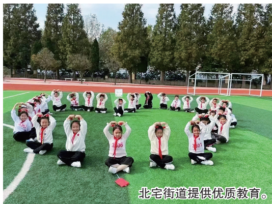
北宅街道提供优质教育。

为了改善办学条件,推进优质教育,崂山区书院学校投入使用新的校舍和装备,改善了街道北片的办学条件;改造提升两所幼儿园,提升学前教育条件;投入资金约90万元,提高幼儿一餐两点标准,保障孩子们健康成长;成立崂山区第一家学区学前教育教研共同体,聘请学前教育专家,定期进行入园指导和教师培训,提升幼儿教师的专业素养水平和教研能力。北宅街道还创设城乡公益性岗位340个,重点安置城