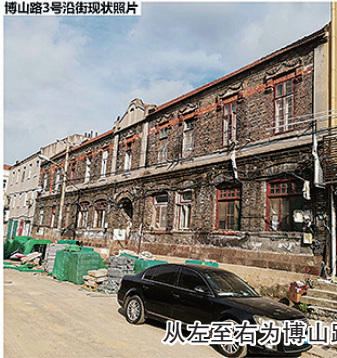
从左至右为博山路3号历史图纸、沿街现状照片、效果图。

史文化街区保护规划》的要求,市南区政府组织编制了该项目保护更新方案,已通过专家评审,市南区行政审批服务局及住房和城乡建设局同意对该建筑实施保护更新,以实现建筑的保护利用。据了解,该项目建设单位为青岛海明城市发展有限公司,设计单位