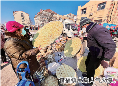
惜福镇大集人气火爆。

走进大集,红彤彤挂满墙的春联、中国结,地上铺满各式各样的“福”字吸引了记者的目光。光是站在这,就能感受到扑面而来的年味。进了腊月门的年集,卖肉与卖海鲜的摊位总是人气最高的。此外,用于放各种面食,特别带有年味的“盖垫”也很受欢迎,小的25元,大的80元,看到象征着团团圆圆的“盖垫”,仿佛就看到了大年三十,一家人围着“盖垫”,聚在一起包饺子的场景。除了这里,青