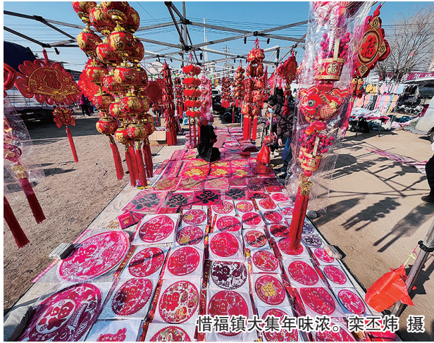
惜福镇大集年味浓。