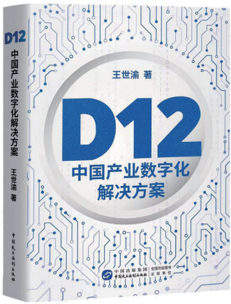
王世渝 著 中国民主法制出版社 2022年11月出版

中国资深投资银行家、全球并购专家王世渝从2019年开始深度研究和思考数字经济,大量阅读从通信到计算机、互联网领域的各种文章、报告、白皮书,产生了对于数字经济定义、内容、理论、方法独特的理解。