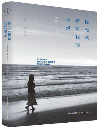
安琪 著 北岳文艺出版社 2022年9月出版

安琪三十年短诗选《你无法模仿我的生活》,呈现了一个起步于新时期文学的知识女性的成长轨迹:理想的辉照、现实的教育,异乡的悲喜、故乡的回望,自然的淘洗、历史的感悟,都在诗中得到了体现。安琪的诗歌语言,不拘泥于某种固定的风格,而是根据所写题材的需要灵活采用适合的表达方式,给予读者生动、丰富、驳杂的阅读感受。安琪的先锋性,体现在诗作中即为清醒的问题意识,和重新辨认习见事物与众不同处的能力。