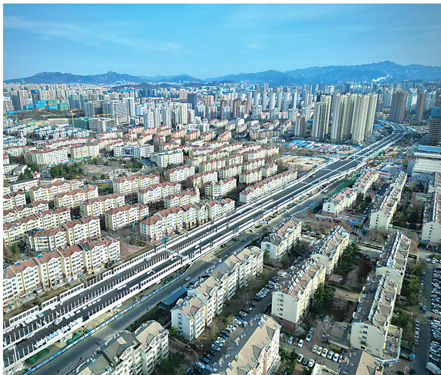
辽阳路快速路如一条蜿蜒“长龙”。

16日上午，记者来到辽阳路快速路施工现场，被眼前蜿蜒伸展的沥青桥面震撼住了。高架桥两侧是林立的高楼；地面上车流不断；桥面上，各类机械和施工工人不停地穿梭忙碌着。这条市民热盼的快速路离开通的日子越来越近了。