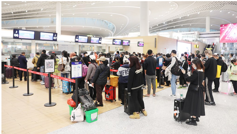
青岛胶东国际机场客流明显增长。

有钱没钱回家过年，对漂泊在外的游子来说，每到年关分外想念的就是家乡。疫情一度阻断了不少人的回家路。随着健康码、行程码和落地检等要求取消，出行逐渐恢复。记者调查发现，近日，我市交通口岸客流出现明显上升，东航青岛地区客流量增长119.4%。