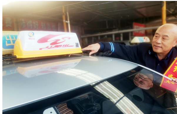
6日，我市新评选出的首批红飘带出租车换装。

市交通运输局城交处副处长任凤磊表示，开展红飘带评选，旨在通过红飘带驾驶员和车辆的典型引领作用，带动全行业进一步服务提升水平。由于职业选择和行业变化等原因，此前评选的红飘带出租车