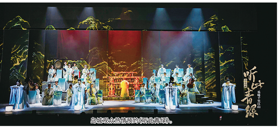
岛城观众热情预约《听此青绿》。

听觉享受有了，视觉盛宴也少不了。《天鹅湖》被誉为世界上最美的芭蕾舞剧，由中央芭蕾舞团演绎的英皇版《天鹅湖》，更是当今世界舞坛公认的最佳版本之一，这部舞剧将于新春季再次来到青岛。