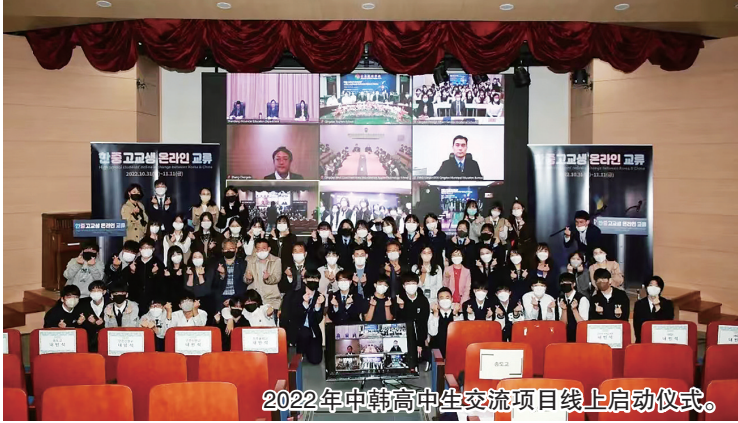
2022年中韩高中生交流项目线上启动仪式。

仁川新岬高中的师生挑选了有趣的韩剧,教青岛外事学校的同学们学习韩语,通过有奖抢答的形式让线上互助学习气氛热烈。青岛外事学校的师生精心准备了汉字讲座,从汉字的起源、分类到书法欣赏,向新岬高中的师生全面展示中国悠久灿烂的文化,还为韩国学生进行了一对一“福”字的书写指