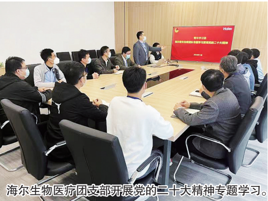
海尔生物医疗团支部开展党的二十大精神专题学习。

本报11月13日讯 近日,为深入学习宣传贯彻党的二十大精神,青岛团市委深化“青年学习荟”品牌,组织青岛市青年讲师团成员和青岛青年先锋、团队优秀代表进高校、进企业、进乡村,开展形式多样的互动式、分众化的宣讲,让党的二十大精神在青少年中入脑入心。