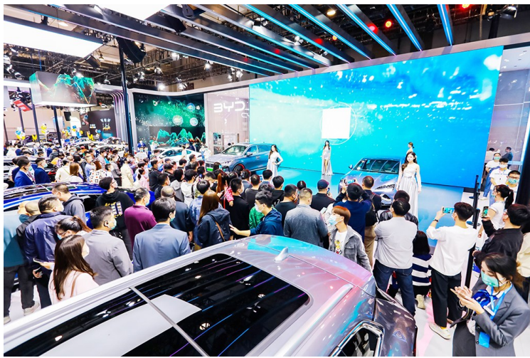
车展现场活动丰富。

展会由山东省工业和信息化厅、山东省农业农村厅、山东省商务厅、山东省能源局指导，山东省汽车行业协会主办，青岛日报报业集团、青岛嘉路博文文旅科技有限公司承办。