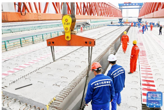
青兰高速公路双埠至河套段女姑口特大桥施工现场。

同一天,随着最后一方混凝土顺利入模,本项目安和路互通主线桥悬浇梁中跨顺利合龙。安和路互