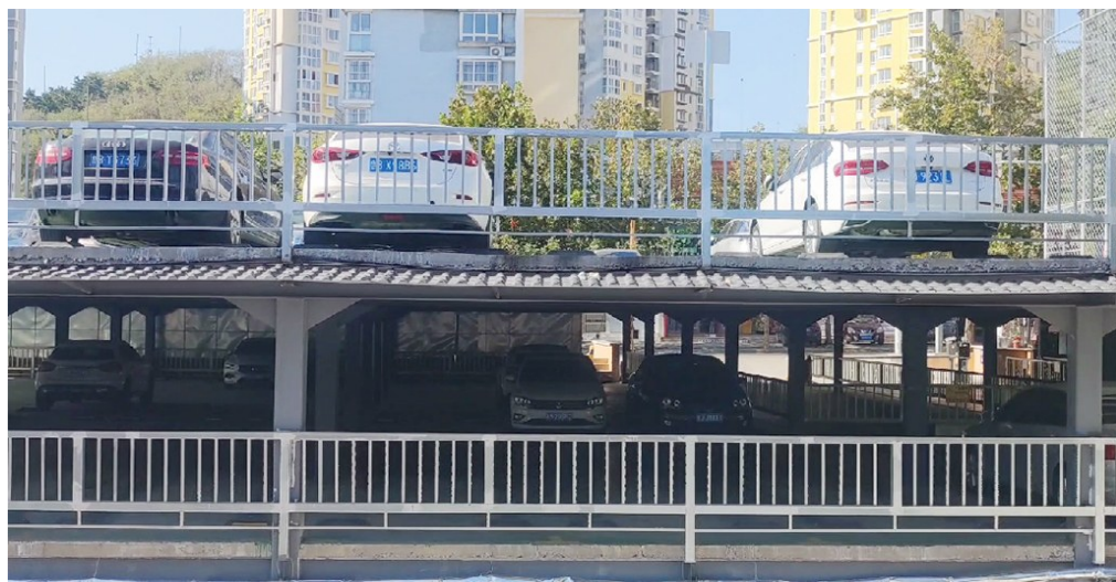
河马石上下三层的立体停车场。

去这里是一处环境脏乱差的历史遗留建筑,街道乘着市北区城市更新和城市建设三年攻坚行动的东风,联合街道“红色合伙人”深挖土地资源,盘活存量空间,建设便民停车场缓解周围居民停车难题。”据了解,目前该停车场建设项目已投入使用,车位使用率达100%,不仅缓解了周边小区停车难问题,同时也改善了民生,做到了停车环境与居住环境双优化。今年以来,市北区结合城市更新和城市建设三年攻坚行动,围绕“停车难”这一热点难点,集众智、聚群力,知难而进,积极作