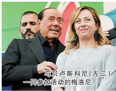
与贝卢斯科尼(左二)一同参加活动的梅洛尼。

意大利25日举行议会选举,大部分选票26日凌晨统计完毕,显示乔治娅·梅洛尼领导的意大利兄弟党及其右翼盟友领先,有望在参众两院均形成稳定多数,有望成为意大利首位女总理。梅洛尼在胜选演说中表露温和基调,呼吁团结。