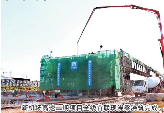
新机场高速二期项目全线首联现浇梁浇筑完成。

青兰高速公路双埠至河套段改扩建工程是国家高速公路网青岛至兰州高速公路东端重要组成路段，主线东起现青兰高速女姑口特大桥起点处，沿既有青兰高速向西，止于河套枢纽互通立交，也是山东省“三横四纵”综合运输通道“济青通道”的重要组成部分，在国家和胶东半岛高速公路网中具有重要地位。按照计划，今年年底该项目新建左幅将建成通车，完成主线第一次转序。