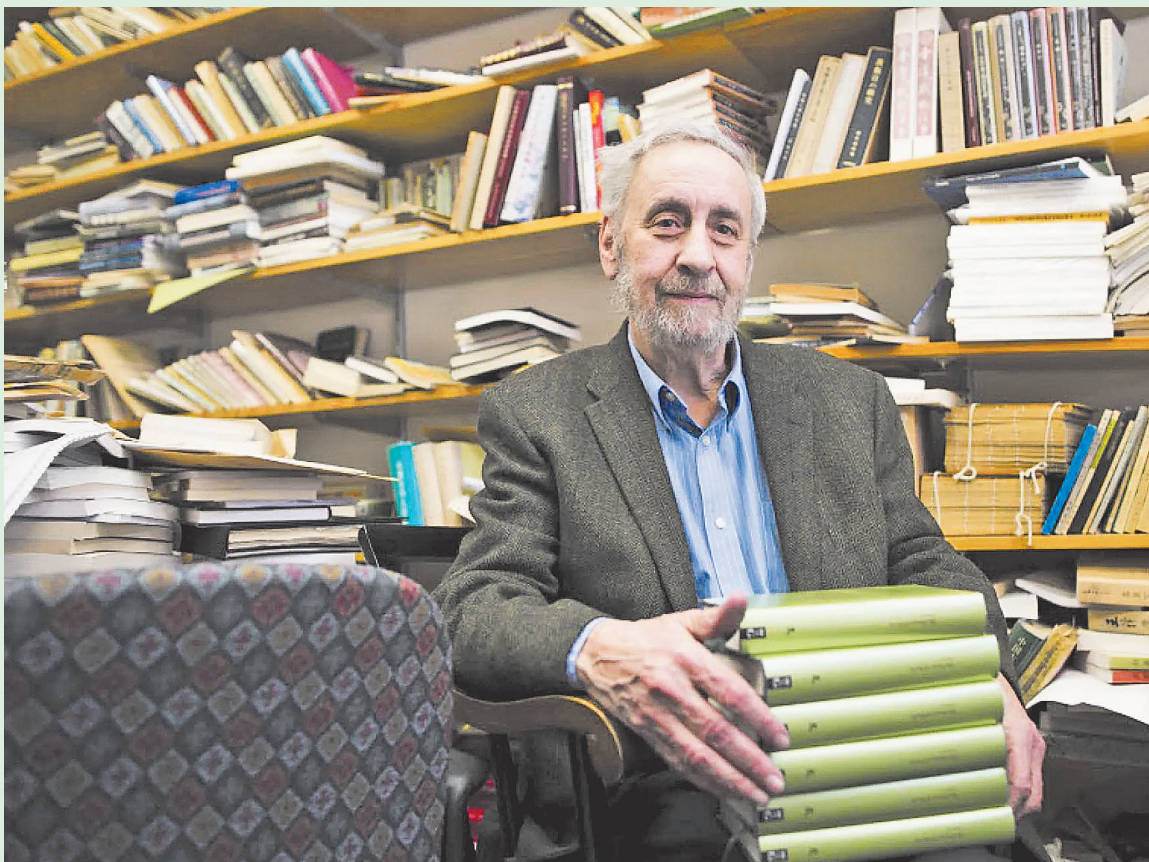
■宇文所安在哈佛办公室书架前，手中是他翻译的“杜诗”六卷本。

回顾宇文所安的一生会发现，这不只是一份西方汉学家学术履历，更像是一个美国少年如何被唐诗带入东方世界，进而开启了一次神奇的文化之旅。