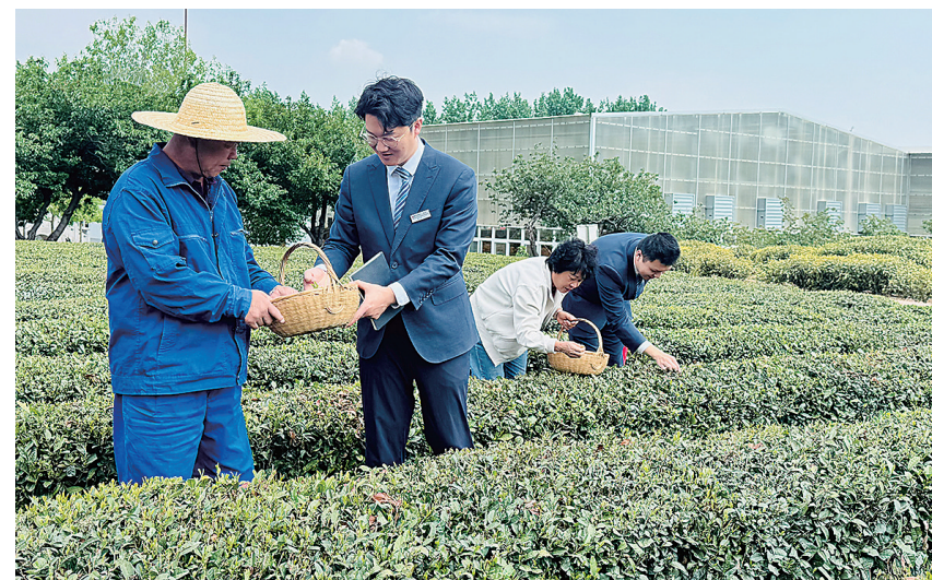
■青島农商银行客户经理走访崂山茶葉种植戶。

科技金融位居“五篇大文章”之首,是发力的重中之重。截至2025年末,该行科技金融贷款余额达163.49亿元,服务户数1417户,对青島市专精特新企业服务覆盖率超40%。其中,国家级专精特新“小巨人”企业贷款余额12.54亿元,服务57户。