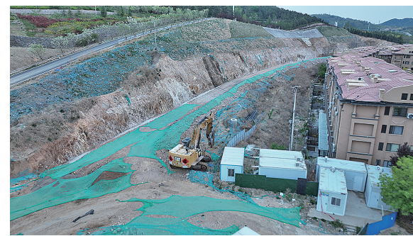
■米罗湾小区南侧的习水路还未通车。

“习水路的合川路至东川路路段迟迟未通车，不知‘卡’在了哪？”近日，有网友在民生在线栏目留言，咨询李沧区习水路打通工程建设进展。