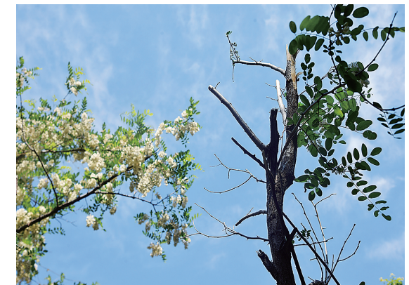
■老虎山公园内槐树枝条被折断。

近日，网友“740Bmd”通过观海新闻客户端“民生在线·帮办”栏目反映，他在李沧区老虎山公园散步时，看到不少槐树遭人为损毁。“有人为了摘槐花，用工具砍断粗壮枝干，树木‘伤痕累累’，残枝遍地的景象令人痛惜。”网友“740Bmd”介绍，受损的槐树位于文圣路沿线。