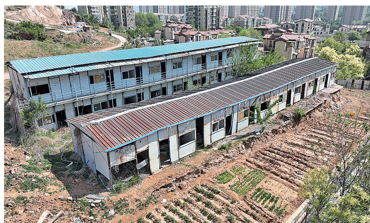
■山水嘉园小区西侧的临时板房破败不堪。

项目建设期间，施工单位往往在项目周边搭建临时板房，用作工人宿舍和办公场所。但项目竣工、工人撤出后，有些临时板房未及时拆除，留存时间甚至长达数年。市民反映，这样的板房破败不堪，还带来环境脏乱问题，希望能尽快清理。