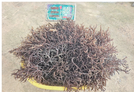
■中国科学院海洋研究所科研团队培育的世界最大长心卡帕藻个体藻株。

□青岛日报/观海新闻记者 李勤祥 本报5月7日讯 日前，记者从中国科学院海洋研究所（简称海洋所）获悉，该所科研团队在长心卡帕藻苗种栽培技术方面取得突破性进展，破解了长期制约我国长心卡帕藻产业发展的关键苗种供应瓶颈问题，培育出超大型藻株，最重的藻株达71.6斤，为迄今为止已知世界上该藻的最大个体藻株。