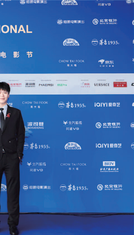
■青岛纪录片《良辰鲁韵寻归处》创作团队亮相北京国际电影节开幕式红毯。

历史建筑从来不是冰冷的砖瓦，也不是尘封的展品，其核心价值在于“活在当下”。对匆匆而过的游客而言，它或许是打卡时的背景板，但对