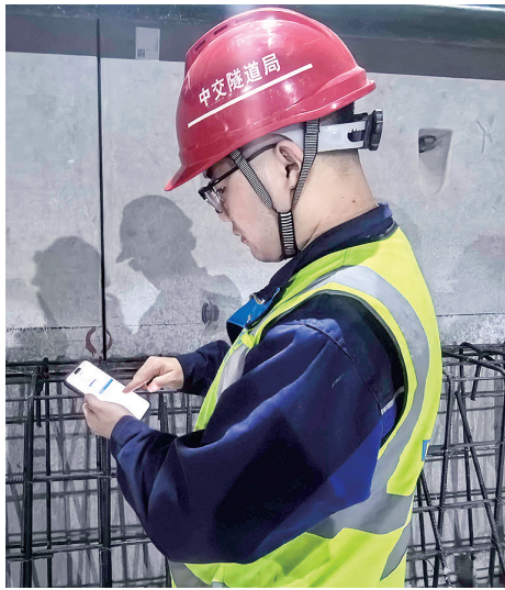
■近日，在胶州湾第二隧道盾构段，现场施工人员在使用数字建造平台手机端进行工序报验操作。

数字孪生： BIM的应用贯穿了二隧工程的始终，实现“地下建造一个海底隧道，同时地上建造一个数字孪生隧道”。