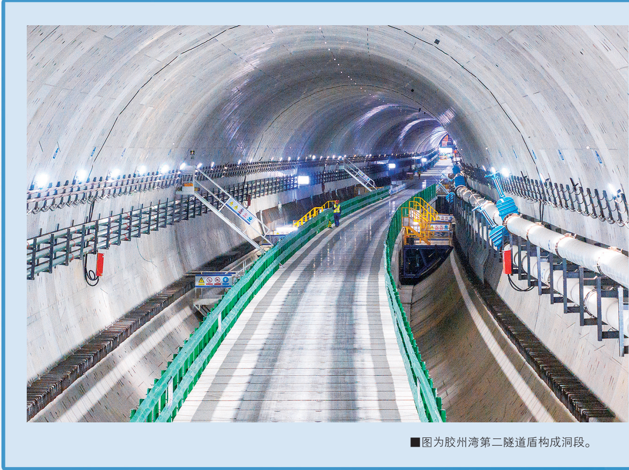
■图为胶州湾第二隧道盾构成洞段。

放眼未来，在推动CIM(城市信息模型)平台建设的宏观背景下，每个建筑工程的BIM应用都在被赋予新的历史角色：它将成为智慧城市数字底座中最具活力的“微观功能细胞”。