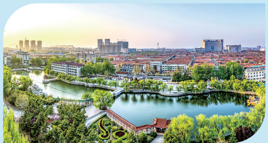
■绿意盎然的水上公园。

四大新兴产业为扩容，前瞻布局N个未来产业，最终实现“传统产业焕新、新兴产业壮大、未来产业布局”，打造半岛新质生产力增长极。