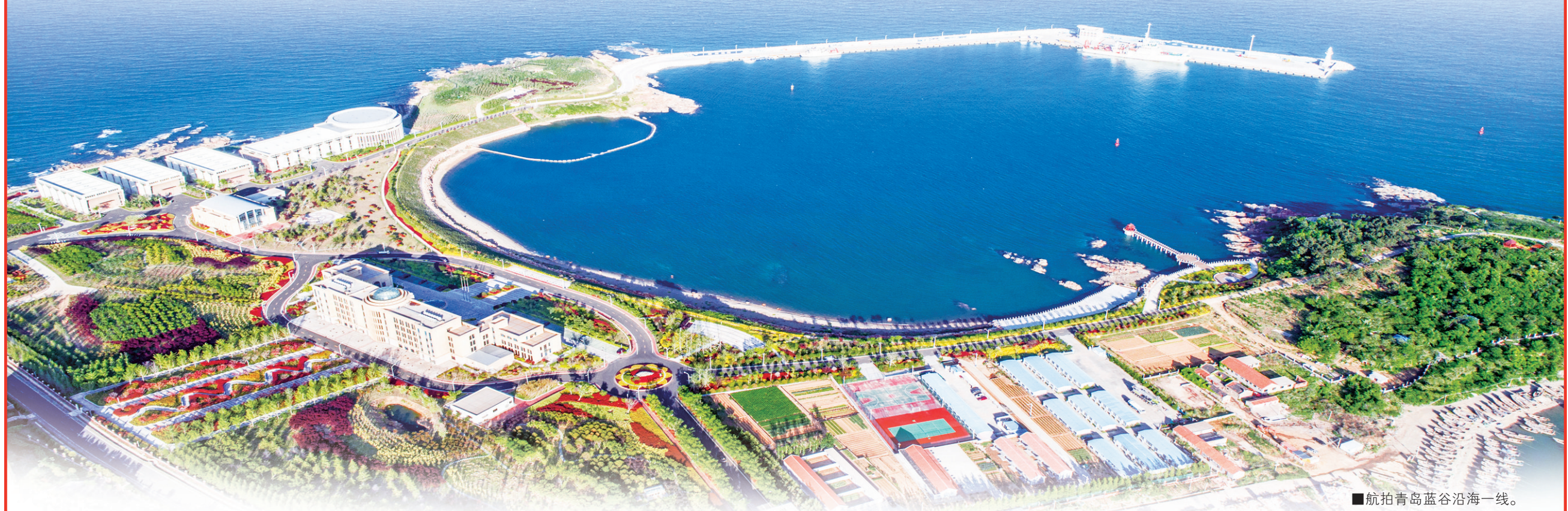
■航拍青岛蓝谷沿海一线。