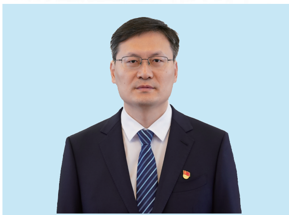
■即墨区委书记 孙杰

“十五五”时期，我们将锚定智能化、绿色化、融合化、高端化方向，聚焦工业经济“头号工程”，紧密承接青岛市“10+1”创新型产业体系，着力构建“1234+N”新型产业体系——以海洋特色经济为引领，以汽车、绿色能源两大龙头产业为带动，以纺织服装、商贸物流、智能家电三大传统产业为支撑，以智能制造、新材料、低空经济、生命健康