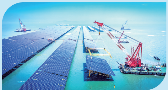
■中电建海上光伏项目吊装现场。