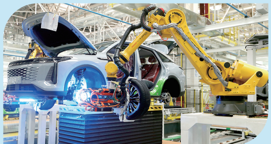
■奇瑞青岛基地新能源汽车智能化生产车间。

2026年是“十五五”开局之年，也是深入贯彻党的二十届四中全会精神、推动区域发展实现良好起步的关键节点。作为青岛主城区向北扩容的核心承载地，即墨区坚定扛牢“立标杆、显作为、作表率”的使命担当，在构建“1234+N”产业体系、推进六大板块协同、激活蓝谷科创动能、推动传统产业转型升级等方面持续发力，加快建设全国海洋经济发展新高地、胶东经济圈一体化新引擎、青岛北部隆起带新核心，奋力绘就活力宜居幸福现代化新区高质量发展新图景。