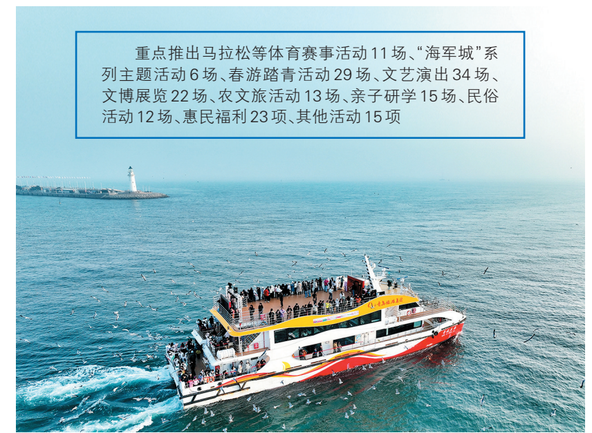
重点推出马拉松等体育赛事活动11场、“海军城”系列主题活动6场、春游踏青活动29场、文艺演出34场、文博展览22场、农文旅活动13场、亲子研学15场、民俗活动12场、惠民福利23项、其他活动15项