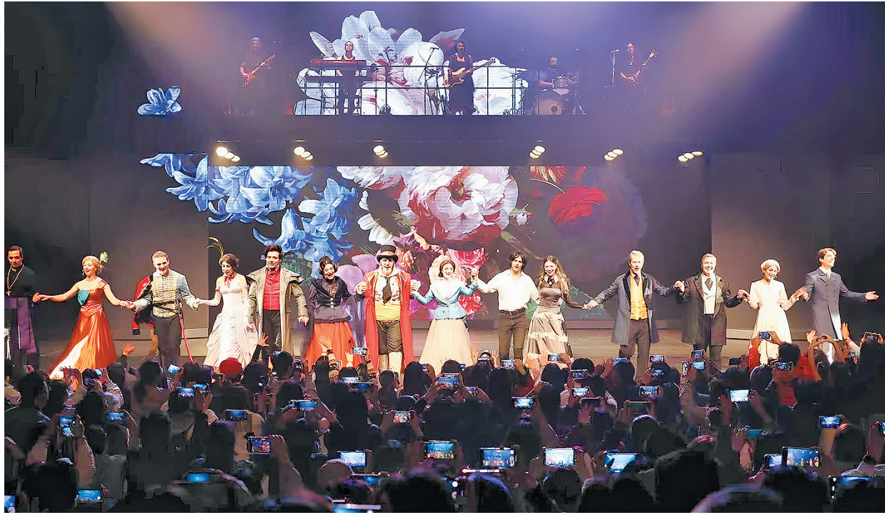
■法语音乐剧《摇滚红与黑》在青岛大剧院连演5场。