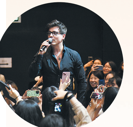
■《摇滚莫扎特》青岛见面会气氛热烈，主演现场演唱经典唱段《纵情生活》。

2026年，法语原版《莫里哀》、英文原版《雨中曲》已提上日程，国风音乐剧也正强势崛起成为行业新风口。在这场音乐剧热潮的背后，隐藏着一些趣味广泛、口味迥异、极具活力却喜欢自称“i人”的高素质影迷。据影迷组织统计，青岛核心粉丝群体近万人，他们口味多元、黏性极强，与高标准剧目相互“催熟”，共同撑起了这片蓬勃生长的音乐剧市场。