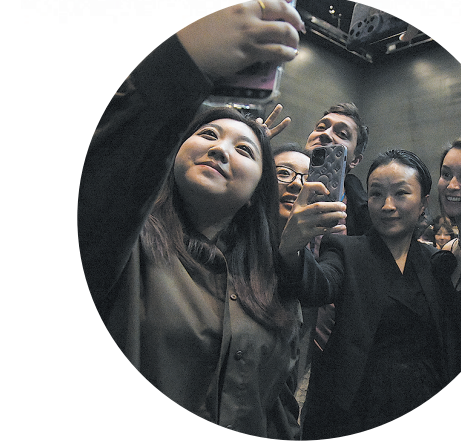
■俄罗斯音乐剧《安娜·卡列尼娜》歌迷见面会现场，音乐剧也成为社交媒介。