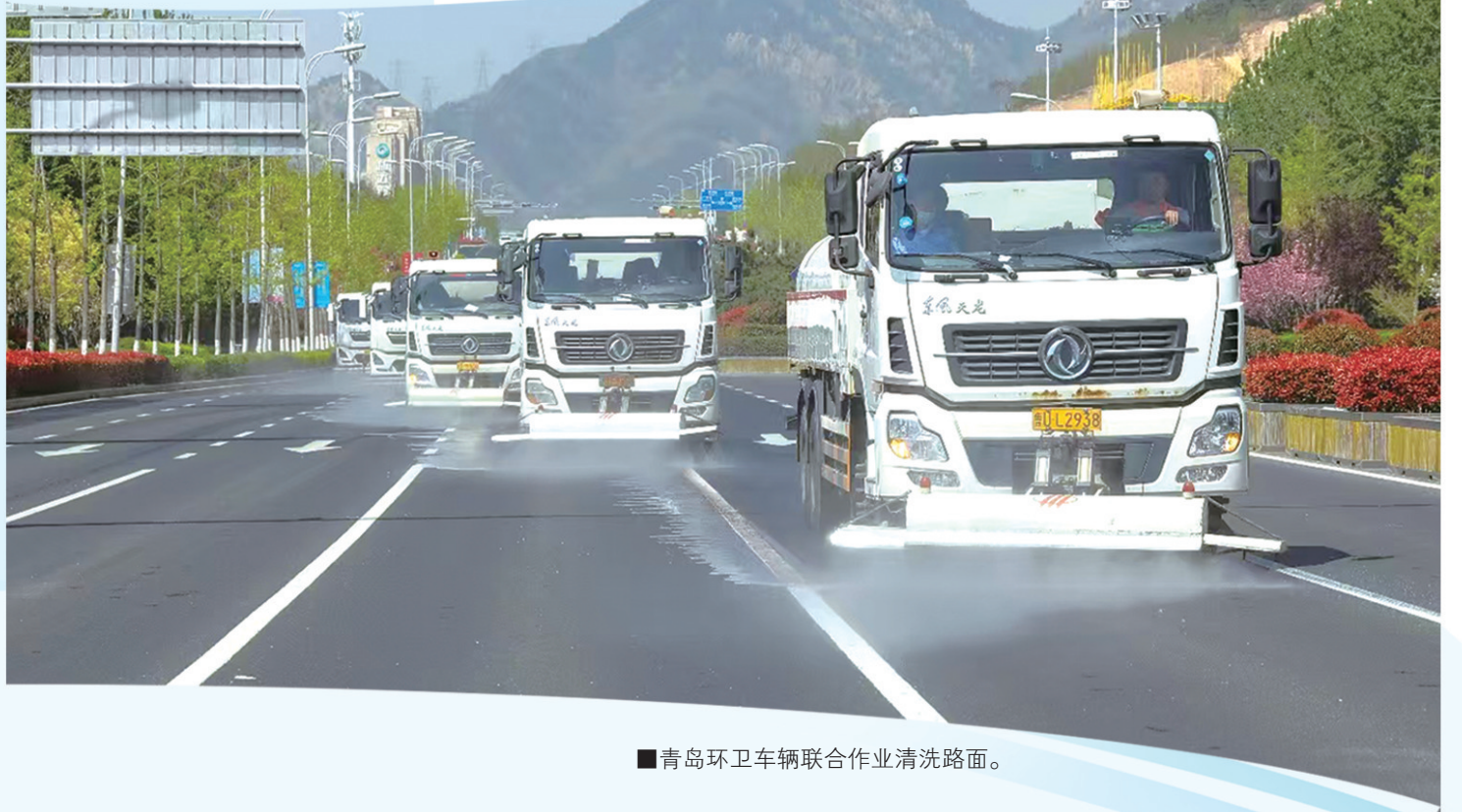
■青岛环卫车辆联合作业清洗路面。

今年以来,青岛市城市管理局立足城市高质量发展全局,以“精治善管”为抓手,统筹推进重点区域洁净提升、日常保洁严格管理、生活垃圾分类、城乡垃圾规范收运、建筑垃圾整治、末端处置保稳提标及数智赋能诉求处置,从城区街巷的精细化保洁到乡村院落的环境焕新,从垃圾全链条管理到民生诉求高效响应,全市环卫系统以绣花针功夫深耕环境治理,既擦亮了城市宜居底色,又夯实了民生幸福根基,推动城市环境品质与群众获得感实现同步提升,为建设高品质现代化城市注入坚实动能。