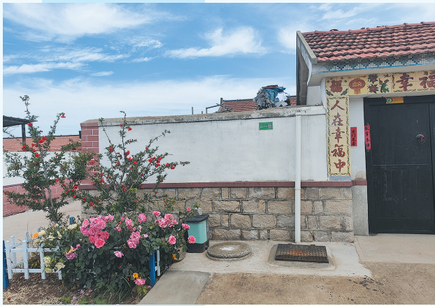
■西海岸新区宝山镇大陡崖村农村户厕管护让人居环境焕然一新。