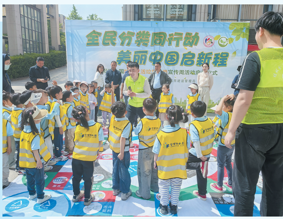
■2025年青岛市生活垃圾分类宣传周启动仪式。