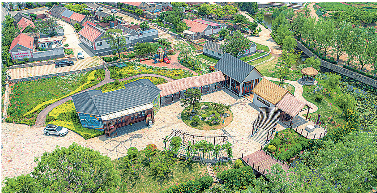
■龙泉街道莲花田园乡村振兴片区。

四舍山6000余亩林海在秋风中泛起碧波，鳌山湾海面数千块光伏平台在阳光下熠熠生辉，全球首艘15万吨级智慧渔业养殖工船“国信1号2-1”在蓝谷开启绿色养殖新时代……5年奋进，绿色不仅点缀山海河川，更融入经济肌理，绘就即墨高质量发展最动人的底色。