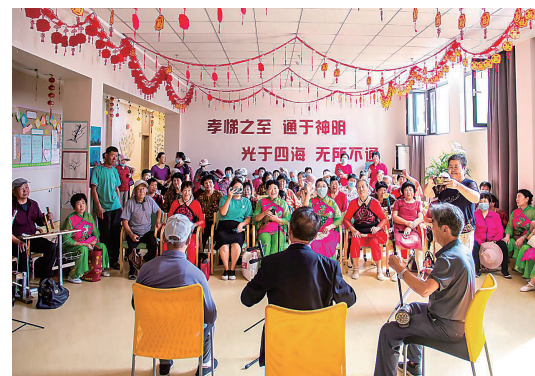
■灵山街道群众性文化演出现场。

时下的灵山，田园与艺术不期而遇。随着第一届“寻艺灵山 塑韵原乡”田园装置艺术季的启动，来自哈佛大学、中央美院、清华美院等国内外顶尖学府的十余位艺术家齐聚于此，他们将用时3个月，以灵山的历史人文与产业特色为画布，用雕塑艺术重塑乡村美学空间。这不仅是即墨区灵山街道深化“文艺赋美乡村”工程中的重要内容，更是乡村振兴片区建设的重要一环。