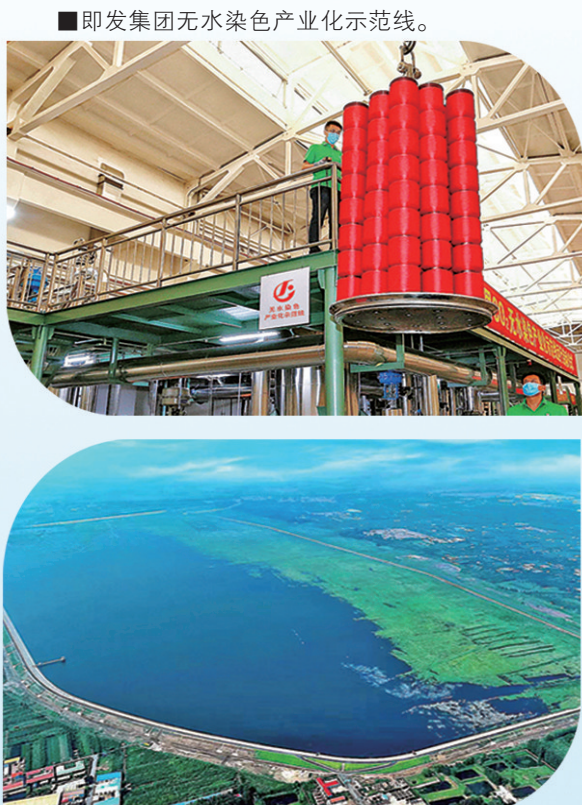
■北安街道宋化泉水库航拍。

下一步，即墨区将聚焦“打头阵、当先锋”目标要求，坚定践行“绿水青山就是金山银山”理念，坚持生态优先、绿色发展，统筹推进生态环境高水平保护和经济社会高质量发展“双保、双促进”，深入打好“两山”转化突破攻坚战，努力在打造国家生态文明建设高地上走在前列，以更高标准打造美丽中国“即墨样板”。