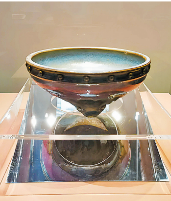
宋钧窑鼓式洗。