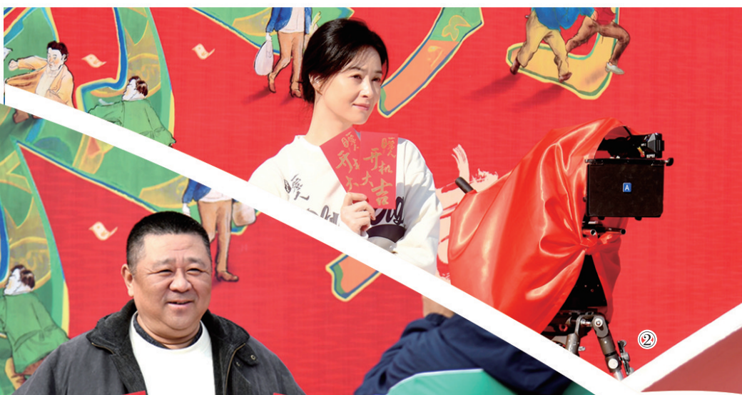
①②③《多喜一家人》开机现场。