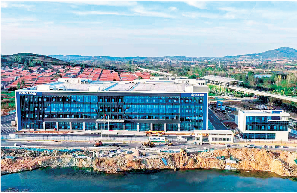
海尔新能源产业互联网生态园将打造全球智慧能源产业互联网示范平台。

生态园一期主体建筑是一栋集办公、展厅、生产、仓储物流等功能于一体的综合性绿色新能源厂房，主要生产光伏逆变器、储能变流器、场景产品、阳台套装等产品，布局了13条专业化生产线，其中包含5条逆变器生产线与8条电路板生产线，全面覆盖智慧能源控制器的研发、制造及销售全链条业务，为海尔新