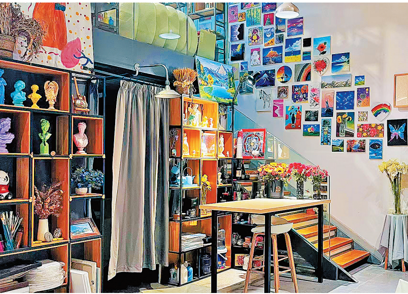
■充满艺术气息的艺间画事工作室。

2017年,艺间画事参与北京水立方国家游泳中心部分闲置区域改造为戏水乐园的墙绘工作。团队精心构思,为乐园增添生动有趣氛围,让游客尽享艺术与娱乐融合的乐趣。画室还与海尔、海信、中粮等知名企业合作开发手绘样板间项目。“传统样板间成本高且空间拥挤,手绘样板间绘制家具家电,不仅节省成本,还让空间更宽敞。”冷杰表示,这段