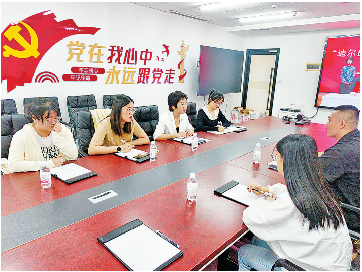
▲迪尔出行(全网)一届一次职工代表大会召开。