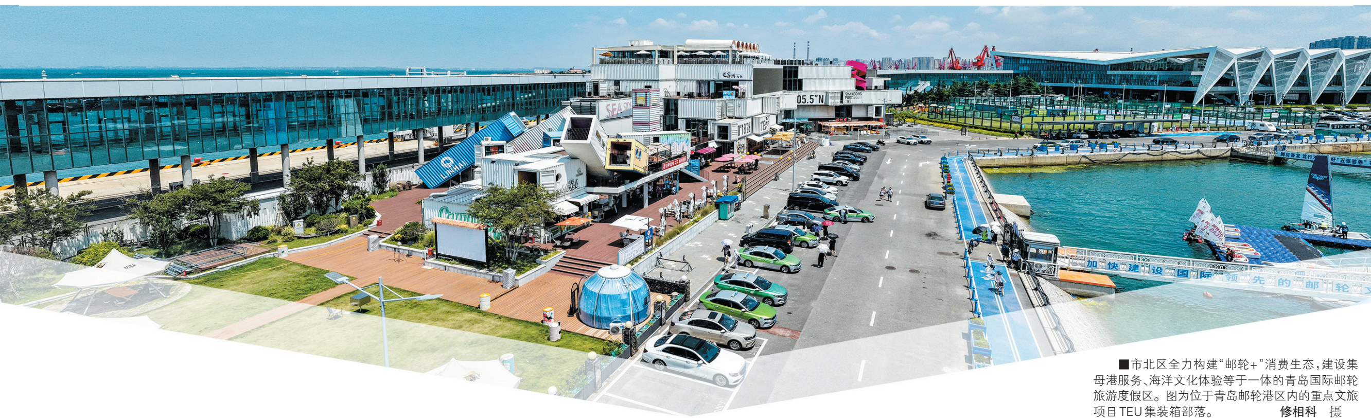
■市北区全力构建“邮轮+”消费生态，建设集母港服务、海洋文化体验等于一体的青岛国际邮轮旅游度假区。图为位于青岛邮轮港区内的重点文旅项目 TEU 集装箱部落。