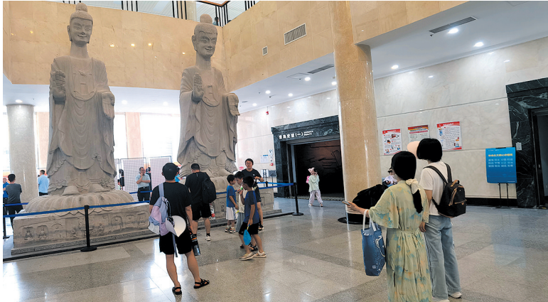
■博物馆一楼的两尊北魏石佛造像是青岛市博物馆镇馆之宝之一。

青岛市博物馆的数字文博常在各类展会上大放异彩。精品馆藏文物制作而成的“数字文博互