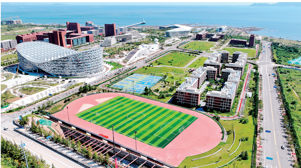
■航拍位于青岛西海岸新区的中国科学院大学海洋学院。

工作者。以两院院士为代表的重量级科学家们,为青岛建设科技强市、打造引领型现代海洋城市构筑了创新策源地。