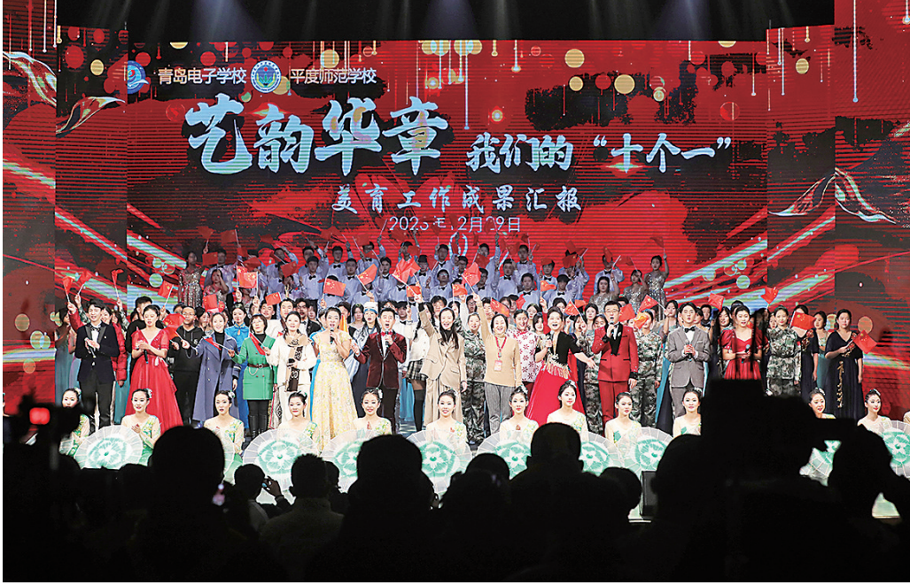
■青岛电子学校、平度师范学校举行“艺韵华章 我们的‘十个一’”美育工作成果汇报演出。

平度师范学校数字媒体专业建设得以共享青岛电子学校积累的行业资源。在青岛电子学校，数字媒体专业已发展为青岛市中等职业学校骨干专业、山东省品牌专业，学校被教育部职成司列为全国7所数字媒体技能教学示范项目试点单位之一，是山东唯一的试点。学校还是全国工