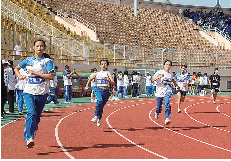
■青岛电子学校、平度师范学校联合运动会。

信行指委通信分委会副主任委员单位、中国职业技术教育学会工业互联网技术专委会副主任单位，牵头制定过全国中等职业教育《现代通信技术应用专业》等两个专业教学标准。