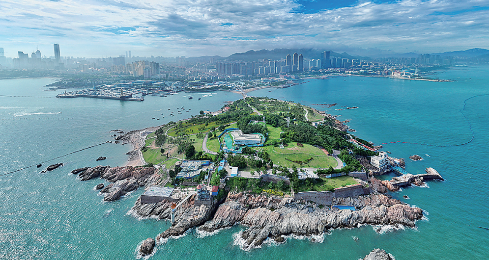
■俯瞰青岛小麦岛风光。

“过去无人机拍摄的影像需要人工解译和分析，整个过程繁琐耗时，至少要2天时间。”市环境保护科学研究院高级工程师刘倩表示，