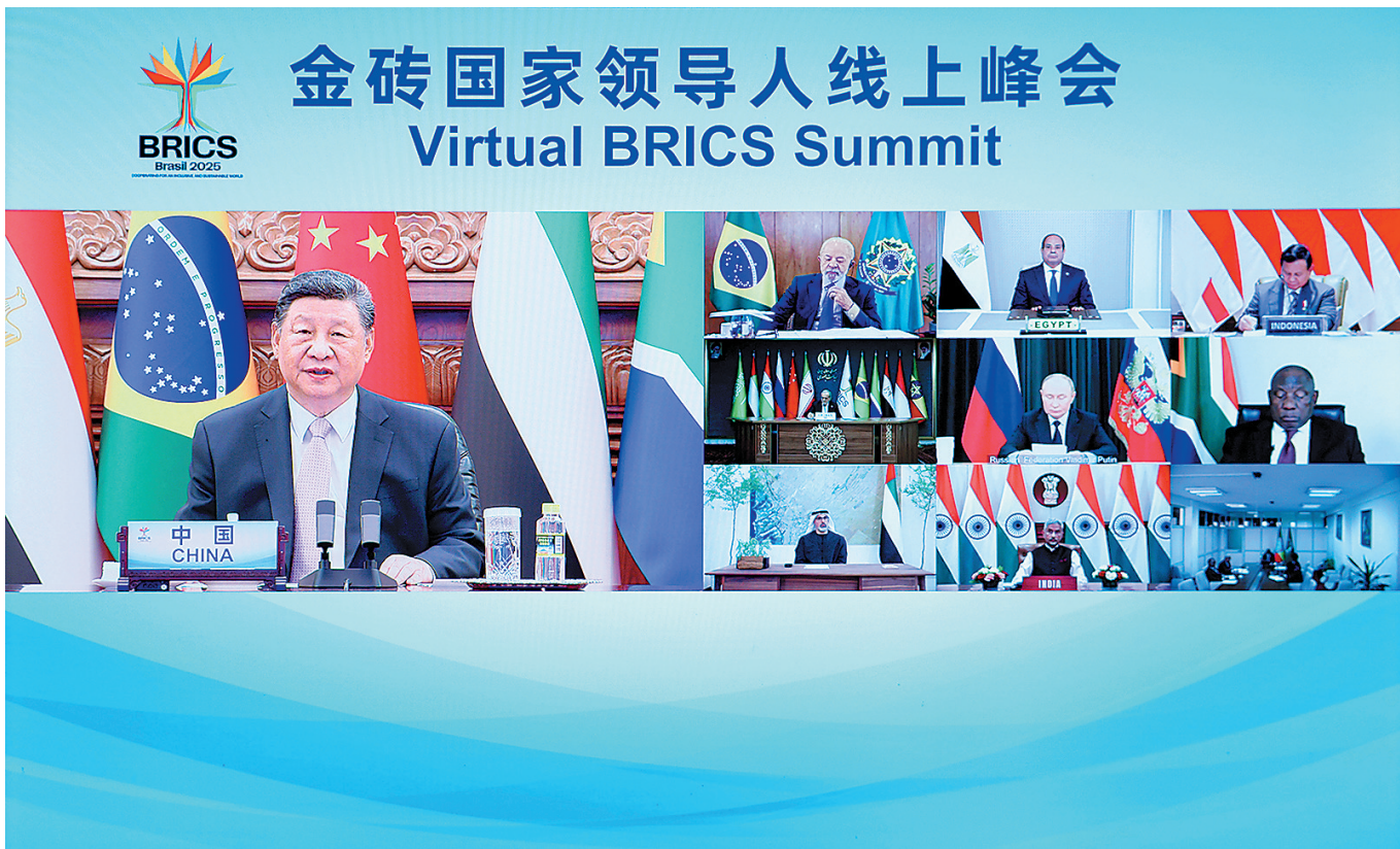
9月8日晚,国家主席习近平出席金砖国家领导人线上峰会,并发表题为《团结合作 砥砺前行》的重要讲话。