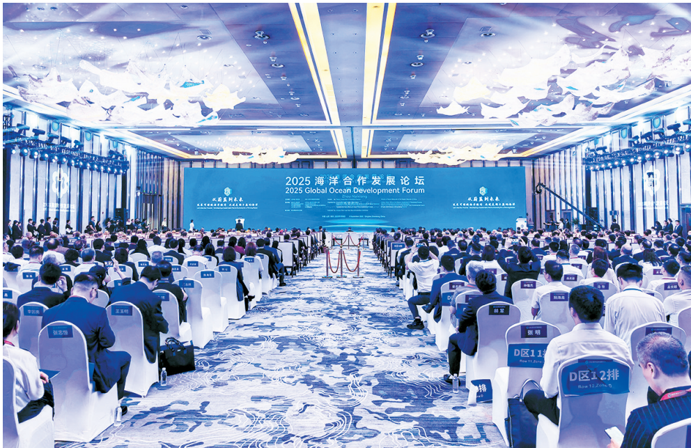
9月8日上午,2025海洋合作发展论坛在青开幕。

林武表示,近年来,山东认真贯彻落实习近平主席重要指示要求,锚定“走在前、挑大梁”,着力打造现代海洋经济发展高地。面向未来,我们愿同各