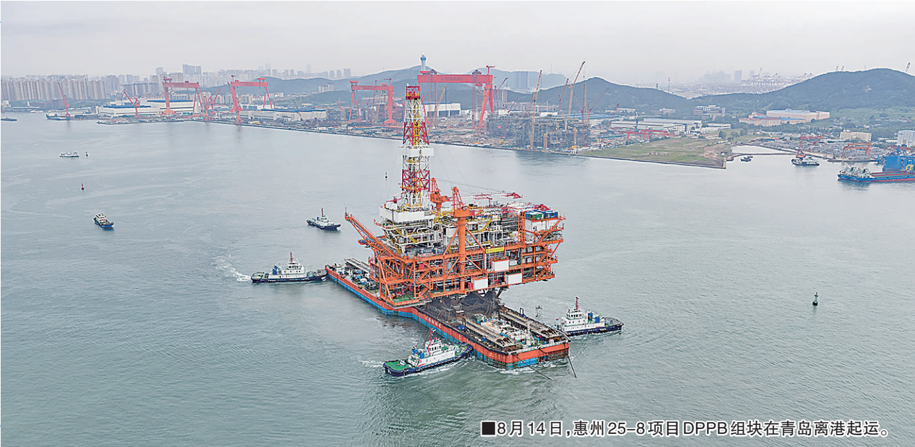
■8月14日，惠州25-8项目DPPB组块在青岛离港起运。

市交通运输局相关负责人表示，目前，青岛已启动“十五五”现代物流业发展规划编制工作，将突出“物流降本增效、国际航运中心”双核驱动，聚焦强枢纽、畅通道、聚产业，争取将更多重大项目纳入规划，为交通强国建设贡献更多青岛力量。