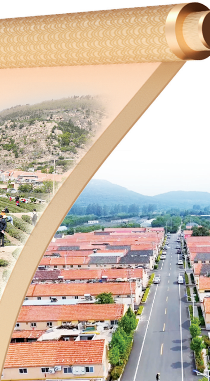
■即墨区鳌山卫街道新河庄村村容村貌干净整洁。