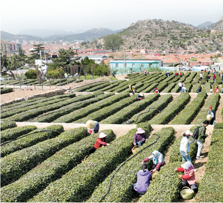
■崂山区的乡村茶园吸引市民游客前来体验采茶。

青岛市立足“大都市带大乡村”市情,坚持一张蓝图绘到底。从2017年起,每年支持建设100个市级和美乡村,截至目前,全市已建成市级和美乡村800个,省级和美乡村286个,农村居民幸福感进一步提升,新时代和美乡村竞展新姿。