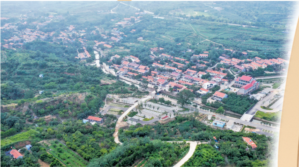
■西海岸新区铁山街道杨家山里乡村振兴示范片区青山环绕。