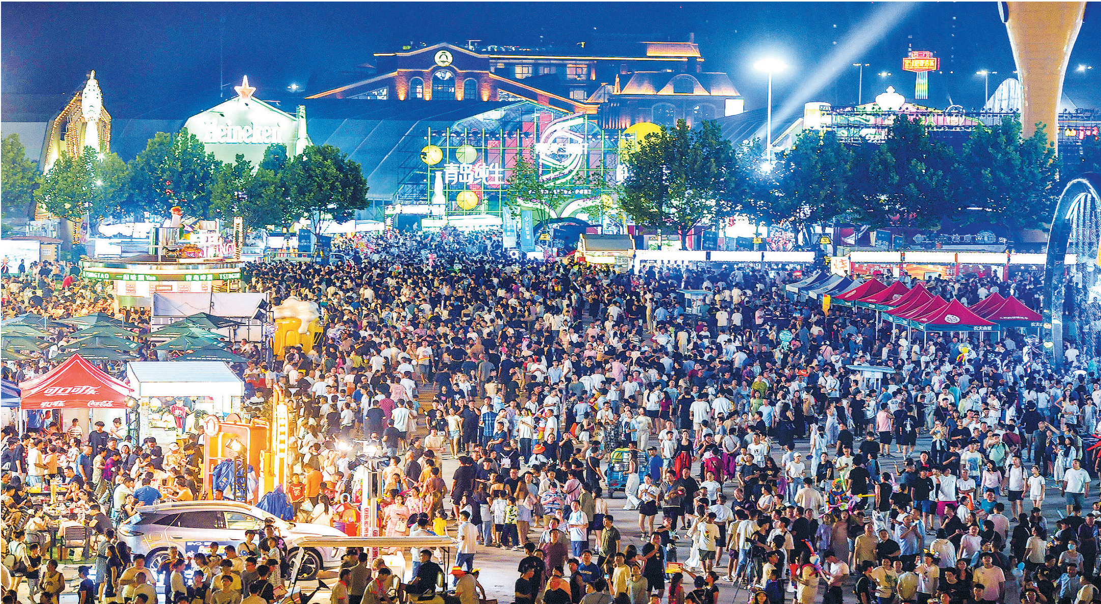
■金沙滩啤酒城人潮涌动。