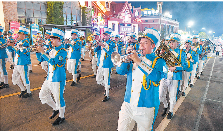
■外国乐队参加金沙滩啤酒城巡游。