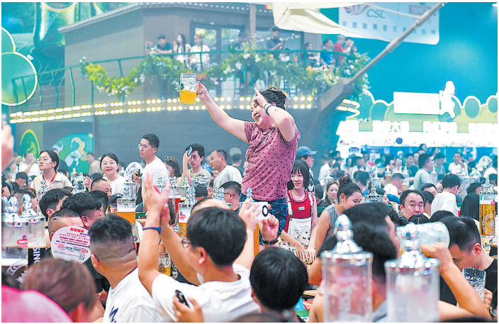
■市民游客在啤酒大篷里激情畅饮。