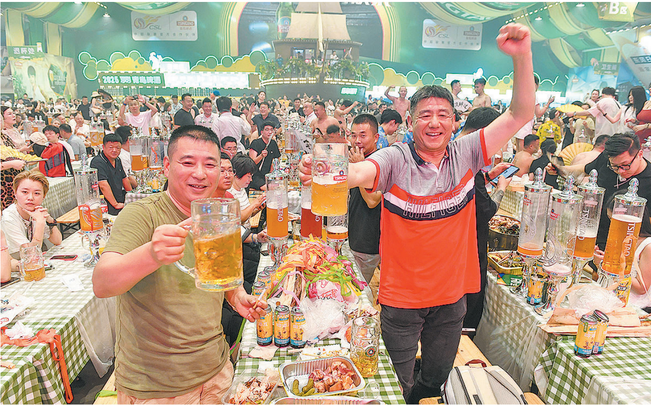
■喝到尽情处，举杯高歌《干杯，朋友》。