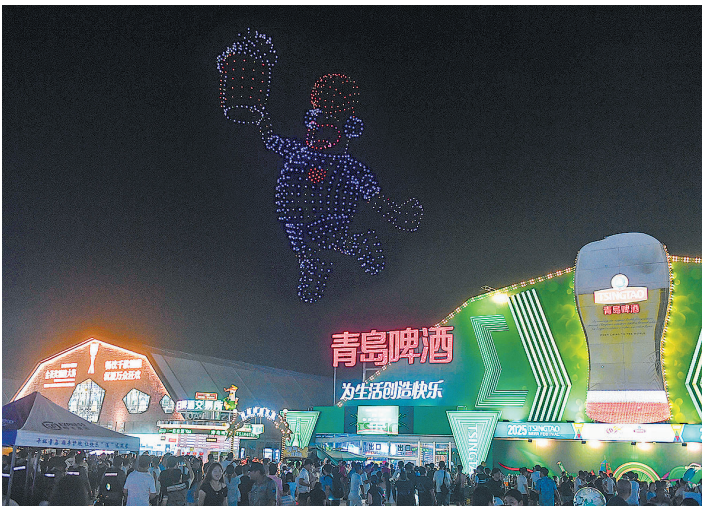
■金沙滩啤酒城上空的无人机表演，展现吉祥物“哈舅”形象。