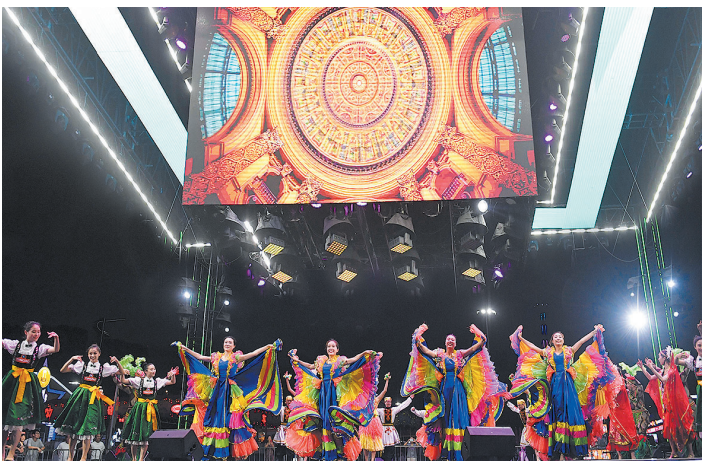
■上合组织成员国艺术节上展演异域歌舞。