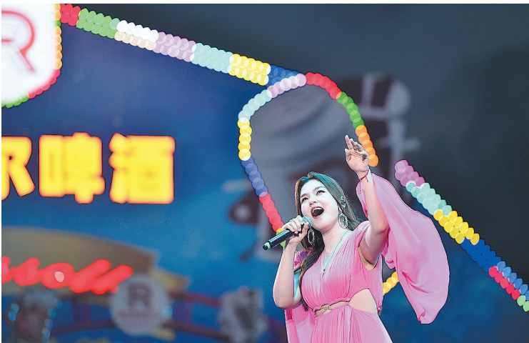
■哈萨克斯坦女歌手在青岛国际啤酒节“上合周”上演唱民族歌曲。