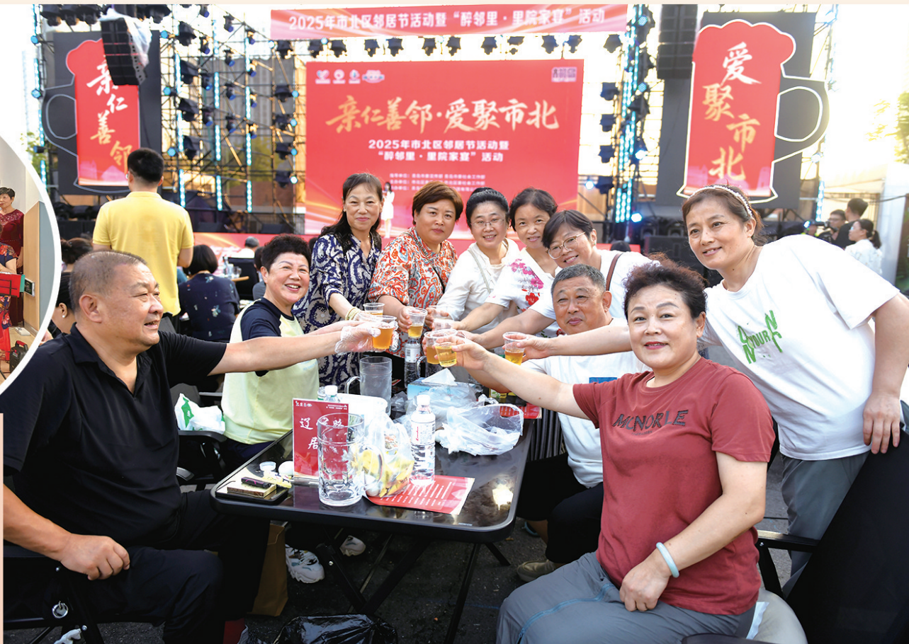
■社区邻里欢聚一堂，共迎邻居节。