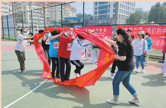
■即墨路街道广兴里社区举办趣味运动会。