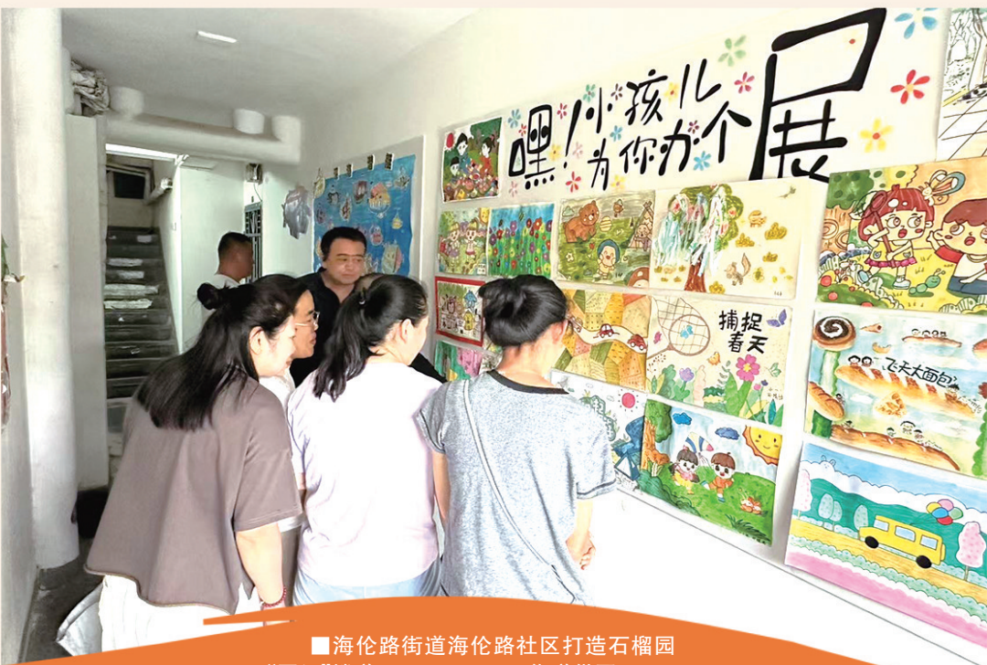
■海伦路街道海伦路社区打造石榴园“网红”楼道。