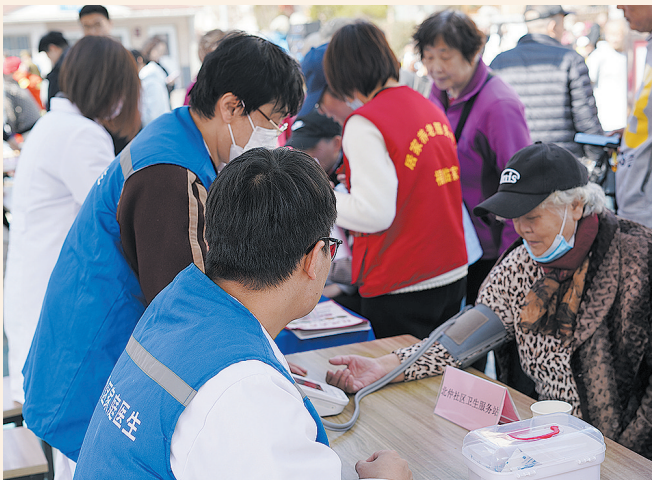
■镇江路街道海泊河社区举办服务大集，为老人义诊。

市北区邻居节作为培育和践行社会主义核心价值观、建设文明城市的重要载体，已走过21年。此次活动让“亲仁善邻”的理念在老城区的里院烟火中持续传承。随着这些优秀品牌的不断推进，“幸福市北”的未来将更加令人期待。