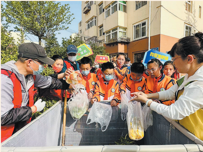
■洛阳路街道郑州路社区“绿循环·幸福家”项目方组织郑州路第二小学的环保志愿者们进行果皮堆肥。