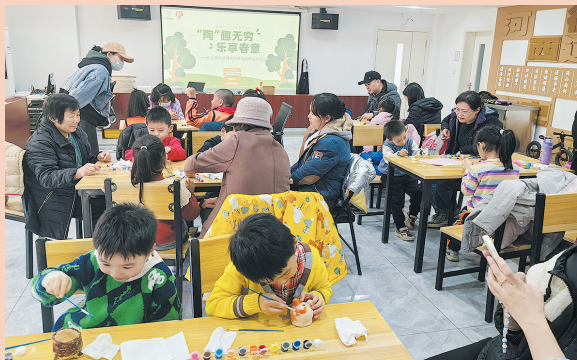
■河西街道长沙路社区组织孩子们开展环保主题绘画。