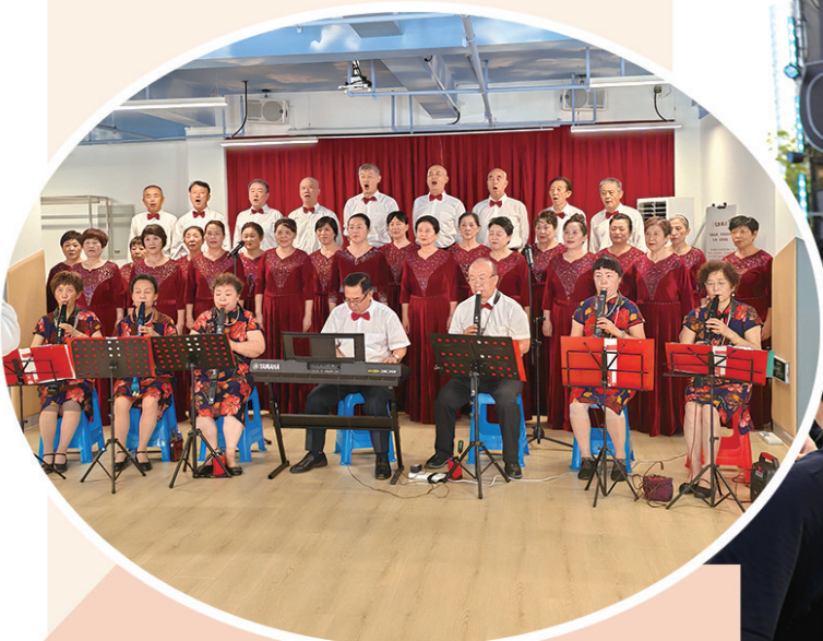
■开平路街道方城路社区组织居民成立合唱团。