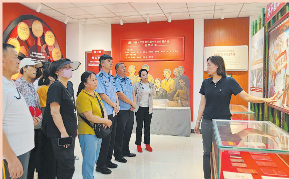
■大港街道普吉社区组织党员群众参观“星火燎原英烈千秋——王荷波在青岛”主题馆。