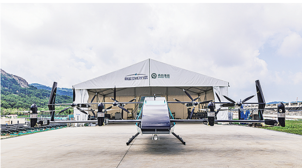
7月25日,青岛地铁1号线凤凰岛站停机坪上,eVTOL飞行器准备起飞。周建亮 摄

□青岛日报/观海新闻记者 周建亮 本报7月25日讯 低空经济“引擎”轰鸣,青岛加速拓展应用场景。25日上午,青岛地铁集团与青岛蔚蓝空间飞行器公司、中信海直(青岛)通用航空公司携手,在地铁1号线凤凰岛站开展2吨级eVTOL(电动垂直起降飞行器)海洋海岛运输拓展测试,凤凰岛“海上瞰青岛”旅游观光项目试运营飞行、动力滑翔伞飞行常态化运营、西海岸新区无人机地铁保护区常态化自主巡查、无人机大规模光伏板自动清洗等同场地低空经营示范场景展示活动。 上午,一架飞行器从地铁1号线凤凰岛站停机坪起飞,首次实现了2吨级纯电动全倾转eVTOL在起飞场地尺寸仅有15米×20米(不足飞机外廓尺寸1.5倍)的城市内狭窄场地垂直起降。在之前的飞行测试中,飞行器穿越山谷、跨越