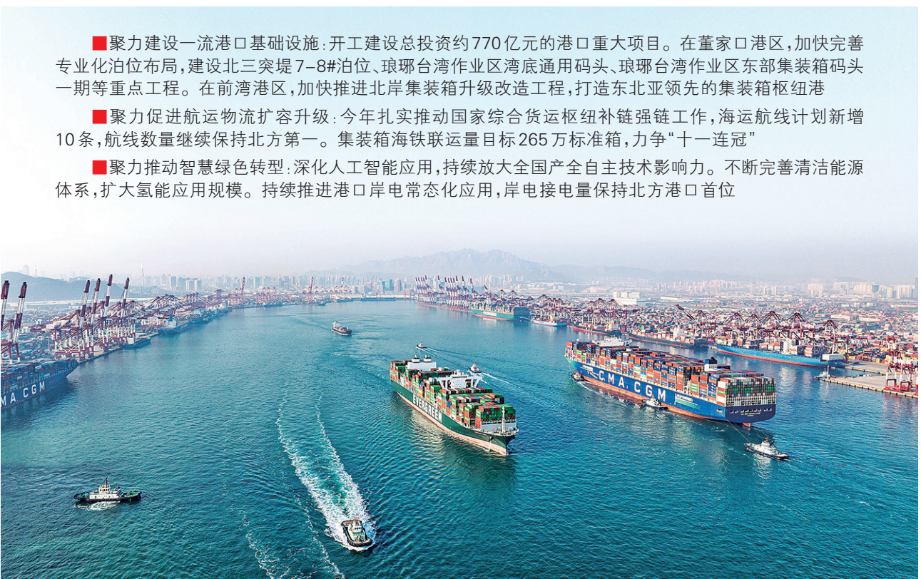
山东港口青岛港前湾港区大船进出,一派繁忙景象。 群建设,青岛将重点做好三个聚力:一是聚力建设一流港口基础设施。开工建设总投资约770亿元的港口重大项目。在董家口港区,加快完善专业化泊位布局,建设北三突堤7-8#泊位、琅琊台湾作业区湾底通用码头、琅琊台湾作业区东部集装箱码头一期等重点工程。在前湾港区,加快推进北岸集装箱升级改造工程,打造东北亚领先的集装箱枢纽港 二是聚力促进航运物流扩容升级:今年扎实推动国家综合货运枢纽补链强链工作,海运航线计划新增10条,航线数量继续保持北方第一。集装箱海铁联运量目标265万标准箱,力争“十一连冠” 三是聚力推动智慧绿色转型:深化人工智能应用,持续放大全国产全自主技术影响力。不断完善清洁能源体系,扩大氢能应用规模。持续推进港口岸电常态化应用,岸电接电量保持北方港口首位

□青岛日报/观海新闻记者 周建亮 本报7月25日讯 25日下午,省政府新闻办召开政策例行吹风会,对刚刚发布实施的《山东省港口与航道布局规划(2025—2035年)》(以下简称《布局规划》)进行解读。在打造开放融合、支撑有力的世界级海洋港口群方面,《布局规划》进一步突出青岛港国际枢纽港的地位和作用,明确提出以青岛港为龙头,烟台港、日照港为两翼,威海港、滨州港、东营港、潍坊港为补充的“三主四辅”世界级海洋港口群布局。加快构建国内国际“5+5”海上运输通道,打造东北亚国际航运枢纽和世界一流海港。 《布局规划》对未来十年山东沿海和内河的港口、航道总体布局进行了全面谋划,是山东港口与航道的中长期布局规划,主要明确了我省港口和航道的总体布局、水运重要运输系统布局及各个港口的功能定位,是指导全省构建沿海港口辐射东西、内河水运连通南北的现代水运体系的纲领性文件。《布局规划》共包括规划基础、总体要求、世界级海洋港口群、内河水运网、港口运输系统、水运一体化高质量发展、环境影响评价和保障措施等八部分内容。 《布局规划》明确提出,至2035年,山东将建成“能力充分、保障有力、安全高效、智慧绿色”的港口与航道体系,形成“三主四辅”世界级海洋港口群、“一主四辅多点”内河港口群和“一纵两横、三千多支”内河航道网的水运发展总体布局,世界级海洋港口群基本建成,内河水运网络更加完善,现代化专业化运输系统支撑更加高效,水运一体化高质量发展成效凸显,港口和航道引领区域经济发展能力显著增强。 青岛港是国际枢纽港、世界第四大港。去年8月,《青岛港总体规划(2035年)》获得交通运输部、省政府联合批复,规划形成“一湾两翼辖六区”的总体发展格局。今年7月发布的《新华·波罗的海国际航运中心发展指数报告(2025年)》显示,青岛超越日本东京、韩国釜山,综合实力排名由第15位跃升至第13位,实现2020年以来首次提升,继续领跑中国北方港口群,彰显出青岛国际航运中心建设取得积极成效。这